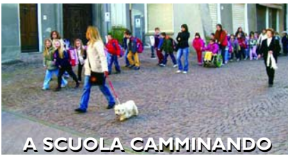
A SCUOLA CAMMINANDO