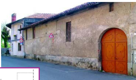
L'attuale aspetto di "Casa Giovetti" e i prospetti delle facciate esterna ed interna del micronido

Con Determinazione Dirigenziale del 28 marzo 2008 la Regione Piemonte ha approvato la graduatoria dei progetti a sostegno dei servizi per la prima infanzia che verranno finanziati in questo triennio e il progetto del Micro-Nido Comunale di San Giorgio Canavese, con 27 punti, si trova al quindicesimo posto su un totale di 76 progetti ammessi a contributo. Il costo dell'intervento è di circa 400 mila euro (399.900,00) dei quali il 65% sono finanziati dalla Regione Piemonte (259.935,00), il restante 35% resta a carico dell'Associazione Baby Club A.I.C.S.