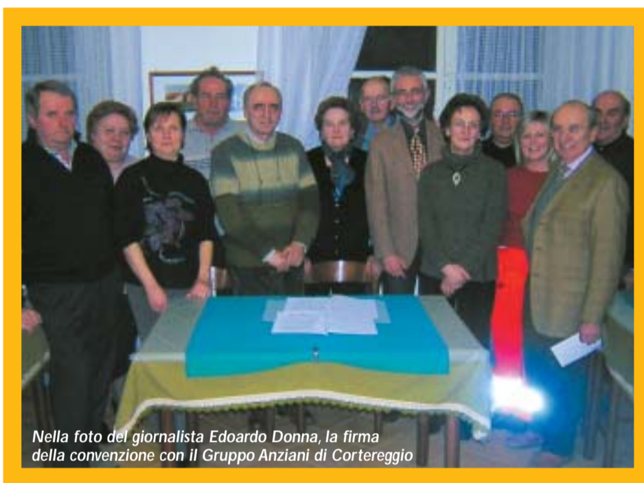
Nella foto del giornalista Edoardo Donna, la firma della convenzione con il Gruppo Anziani di Cortereggio

delle forniture (gas, elettricità, acqua) oltre che delle grandi manutenzioni. Le piccole manutenzioni saranno a carico del Gruppo Anziani, che garantirà la possibilità di utilizzare il Salone da parte di Associazioni, enti e privati, anche di altri Comuni, vigilando sul rispetto della struttura. Le tariffe saranno decise dalla Giunta Comunale, che si riserva anche il diritto a dare ilosta all'utilizzo. Il ricavato verrà suddiviso in parti uguali fra il Comune e l'Associazione, che utilizzerà questi proventi per le spese di gestione del salone.